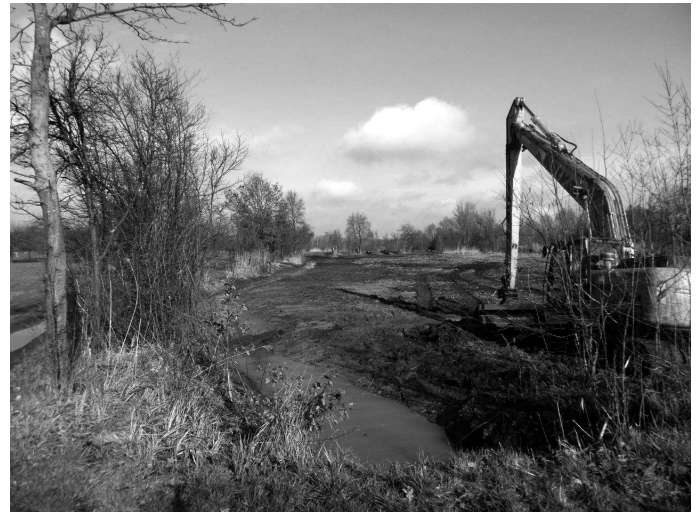
Blick vom Sandsteinrohrdurchlass beim Gewann 'Allmend' in Fließrichtung nach Norden.

Die Gemeinde Kappel-Grafenhausen sucht befristet für die Dauer des Beschäftigungsverbot, des Mutterschutzes und einer ggf. daran anschließenden Elternzeit in der Ferdinand-Ruska-Schule ab sofort