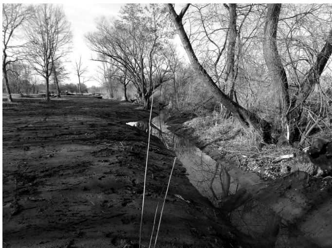
Blick auf den neu modellierten Graben vom Umleitungskanal gegen die Fließrichtung nach Südwesten.

Regierungspräsidium Freiburg, Referat 53.3 - Integriertes Rheinprogramm Dienstsitz Offenburg, Tel.: 0781/12471-1701 oder unter www. irp-bw.de