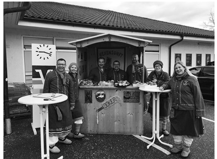
Spendensammlung im November 2018 vor dem Edeka Feißt in Grafenhausen

Nochmals vielen herzlichen Dank an alle Spender. Euer Zunfrat.