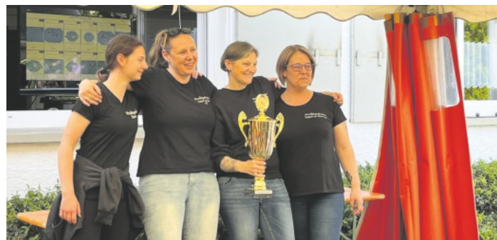
Die Siegermannschaft mit Pokal

Wir gratulieren allen Gewinner*innen und bedanken uns bei allen, die uns unterstützt haben, ganz besonders bei unserem Helfer-Team - vielen Dank, dass ihr alle dazu beigetragen habt, dass dieser Tag so erfolgreich war!!!