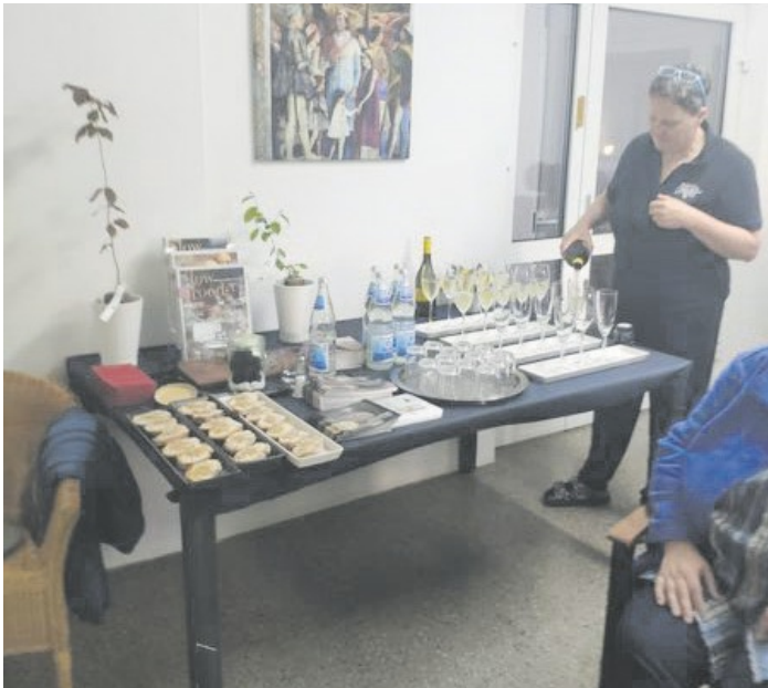
Kleine Verkostung mit frischem Trüffel