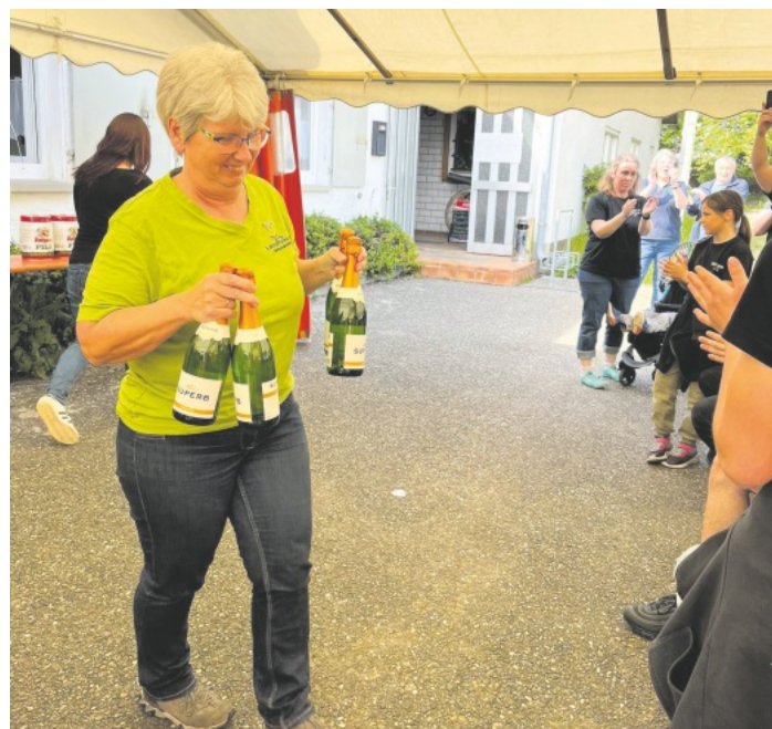
die Landfrauen wurden mit dem 2. Platz belohnt