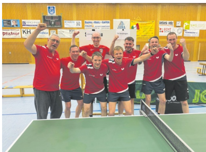
Aufsteiger zur Landesliga