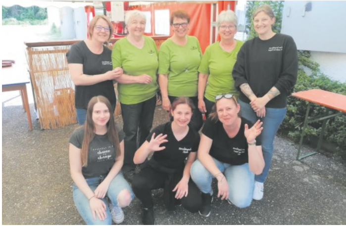
1. + 2. Platzierte

???????????????????????????????????????????????????????????? ? ? alte Namen und ihre Bedeutung ? ? Donnerbalken ? Als Donnerbalken wird eine rovisorische Toiletten- ? anlage bezeichnet, bei der ein Holzbalken als not- ? dürftige Sitzgelegenheit über einer im Freien aus- ? gehobenen Sickergrube angebracht ist. Auf dem ? Balken können mehrere Personen gleichzeitig ne- ? beneinander sitzen und donnern. ? ? Bauchpinseln ? Bauchpinseln beschreibt sinngemäß das Bauch- ? streicheln von Hund oder Katze, die sich als Zei- ? chen des Vertrauens auf den Rücken legen. ? ?????????????????????????????????????????????????????????????