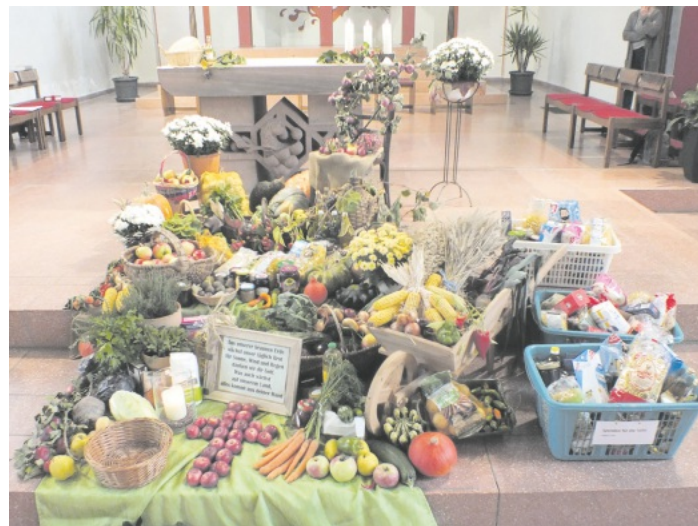
Bild: Viele Menschen brachten Lebensmittel zum Erntedankaltar nach Kappel welches an die Tafel nach Herbolzheim weitergeleitet wird. (Bericht und Bild: Rudi Rest)

Beim Erntedankfest in der Pfarrkirche St. Cyprian und Justina in Kappel, danken die Menschen Gott für die Früchte der Natur, die ihnen mit Schöpfung geschenkt sind zum Überleben sichern. Unter dem Motto „Brotzeit“ hat das Gemeindeteam den Gottesdienst vorbereitet. Dabei spielte das Brot eine zentrale Rolle, denn kein anderes Lebensmittel hat seit Jahrhunderten eine vergleichbare Bedeutung. Aus Solidarität mit den vielen ärmeren Mitmenschen, haben viele Bürger haltbare verschlossene Lebensmittel wie Nudeln, Kaffee, Marmelade, Säfte in die Kirche gebracht welches für die Tafel in Herbolzheim bestimmt ist. Gerade in der derzeitigen Situation wo ein sinnloser Krieg herrscht, Energieknappheit und ein unsichere Arbeitsplätze ansteht, ist es besonders wichtig den ärmsten der Armen durch solch eine Hilfeaktion und Solidarität zu unterstützen.