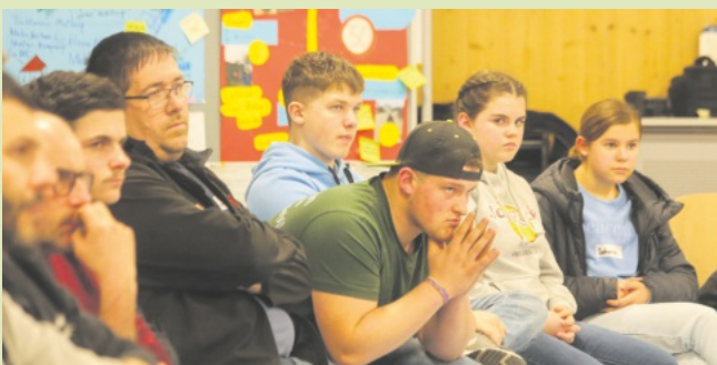
Jochen Paleit, Bürgermeister