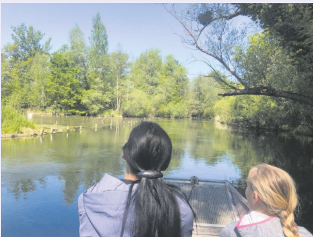
Eine Etappe des Naturerlebnistags führt die Familien per Bootsfahrt durch den Taubergießen, wo sie Spannendes zur Geschichte, Flora und Fauna des Naturschutzgebiets erfahren.

Die Anmeldung erfolgt über das Naturzentrum Rheinauen Gemeinde Rust unter info@naturzentrum-rheinauen.de oder Telefon 07822 8645-36. Weitere Informationen unter www.naturzentrum-rheinauen.eu . Anmeldeschluss ist der 8. Mai 2023.