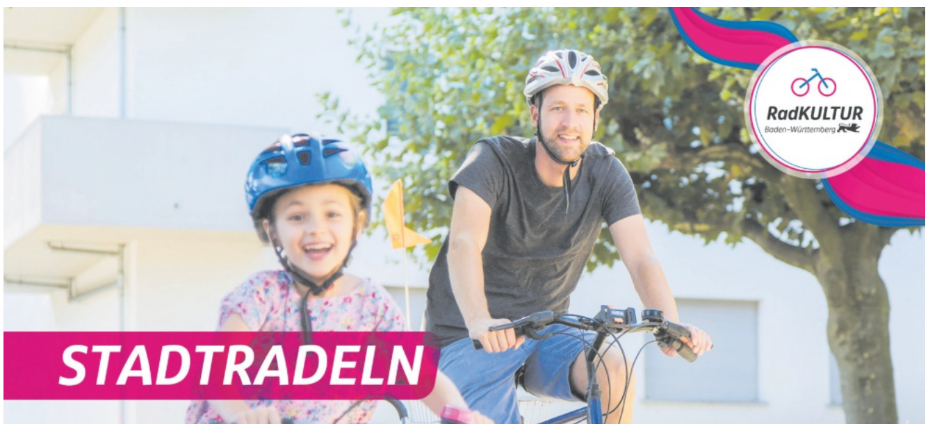
Jochen Paleit, Bürgermeister