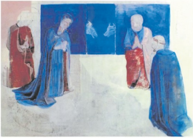
Ökumenisches Hausgebet im Advent