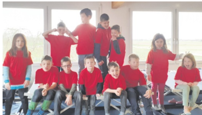
Kinderfeuerwehr Kappel - Grafenhausen