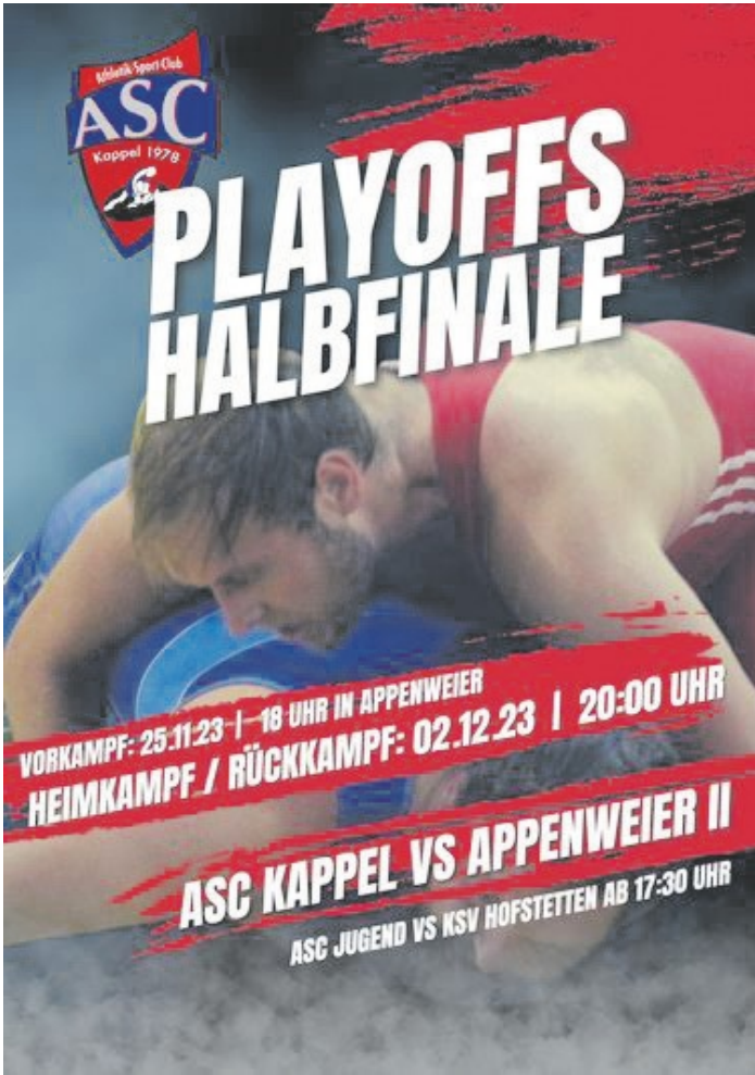
Playoff-Termine Halbfinale ASC