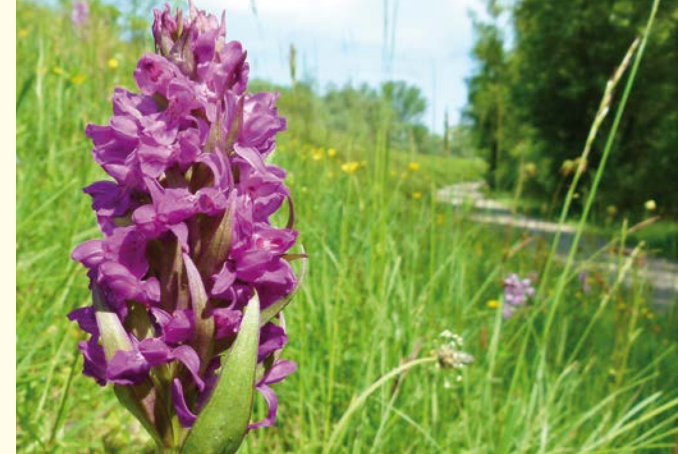
Fleischfarbendes Knabenkraut / Orchis incarnat (Gor)

La réserve naturelle du Taubergiessen se situe dans la plaine du Rhin supérieur, entre les Vosges et la Forêt Noire. Durant des millénaires, le vieux Rhin y a façonné le paysage, donnant naissance à une multitude d'habitats en perpétuelle évolution. Le fleuve et ses milieux alluviaux comptaient parmi les biotopes d'Europe les plus riches en espèces.