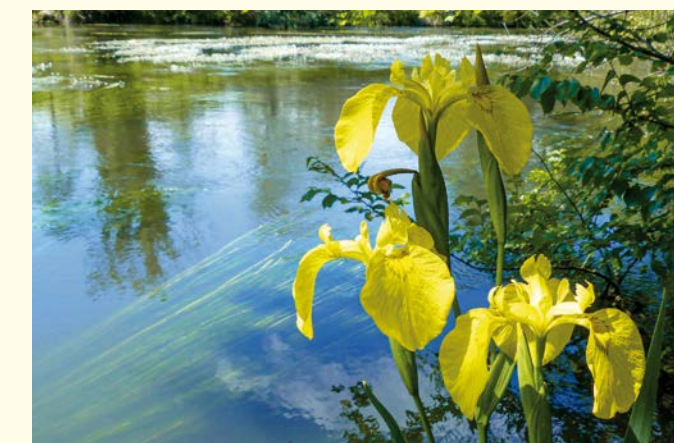
Gelbe Schwertlilien / Iris des marais (Gor)

Préserver cette biodiversité et la favoriser lorsque cela est possible représente un défi de taille, compte tenu notamment du nombre élevé de visiteurs, des différentes volontés d'utilisation du site et des effets du changement climatique.