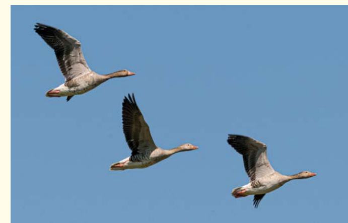
Graugänse / Oies cendrées (Klü)

bancs de sable et de gravier ont disparu au profit de la récupération de terres, de la navigation et de la production d'énergie. L'installation de nombreux ouvrages fluviaux et de seuils pour maintenir le niveau de la nappe phréatique a rendu plus difficile la migration des poissons et d'autres espèces. En outre, le débit du vieux Rhin et de ses bras a diminué de manière critique, le lit majeur du fleuve n'étant dès lors plus que rarement inondé. Des espèces adaptées aux milieux plus secs se sont ajoutées à celles endémiques des zones alluviales du vieux Rhin. La création de digues des hautes eaux a entraîné le développement d'une faune et d'une flore spécifiques, également présentes dans les prairies adjacentes.