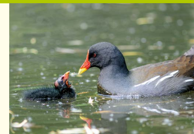
Teichhuhn mit Jungen / Poule d'eau et son poussin (Kai)

d'eau, offrent des conditions de vie propices à l'installation durable du pygargue et du balbuzard.