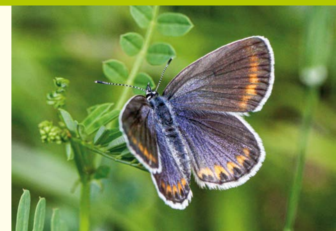
Kronwicken-Bläuling / Azuril des Coronilles (Mei)

Les « giessen », des résurgences de la nappe phréatique, constituent une autre particularité de la réserve naturelle à laquelle ils ont donné leur nom. Pour les pêcheurs, ces cours d'eau très clairs, froids et relativement pauvres en substances nutritives étaient considérés comme « vides », car les poissons y faisaient