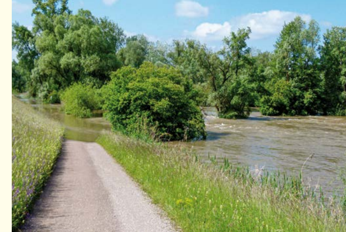
Hochwasser im Taubergießen / Crue dans le Taubergiessen (Gor)

naturelle est propriété de la commune française de Rhinau pour près de 60 % de sa surface. Le Taubergiessen appartient au réseau européen de sites protégés Natura 2000. Il est également reconnu comme une zone humide d'importance internationale dans le cadre de la convention de Ramsar relative à l'espace transfrontalier du Rhin supérieur - Oberrhein.