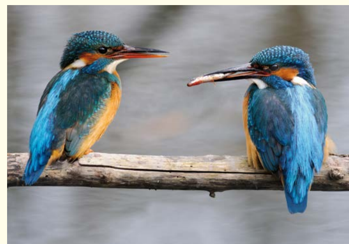
Eisvögel / Martins-pêcheurs d'Europe (Kai)

Fortpflanzung in die kiesreichen Abschnitte des Rheins und seiner Zuflüsse wanderten. Die Eigenart und Schönheit dieser reich strukturierten Flusslandschaft kann man am besten während einer geführten Kahnfahrt erleben, für die es eine begrenzte Zahl an Genehmigungen gibt. Eine weitere Besonderheit des Gebiets sind die vom Grundwasser gespeisten Gießeln, die dem Naturschutzgebiet ihren Namen gaben. Von Fischern wurden die Gießeln, die sehr klares, kaltes und relativ nährstoffarmes Wasser führen, aufgrund des geringen Fischbestands als „taub“ bezeichnet. Hier gedeihen seltene Krusten-Rotalgen.