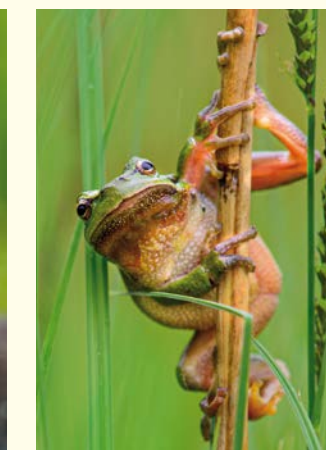
Laubfrosch / Rainette verte (Kai)

Eine Besonderheit im Gebiet stellen die zahlreichen parallel zum Rhein verlaufenden Altrheinarme dar. In diesen Gewässern leben Muscheln, Fische, Krebse, Frösche, Molche und die Larven räuberischer Libellen. Mit etwas Glück kann man eine Ringelnatter oder den Eisvogel sehen. In den Schilfgürteln entlang der dicht bewachsenen Ufer brütet die scheue Wasserralle. Stellenweise finden sich geeignete Laichplätze für die seltenen Lachse, die einst in großen Mengen vom Meer zur