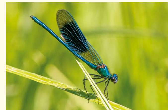
Gebänderte Prachtlibelle / Calopteryx éclatant (Klü)

Chaque année, des milliers d'oiseaux aquatiques font une halte migratoire estivale ou hivernale sur les plans d'eau de la réserve. De l'observatoire, il est possible d'apercevoir plus d'une douzaine d'espèces de canards, des oies et, l'été venu, des sternes pierregarin. Les espaces boisés, riches en cours