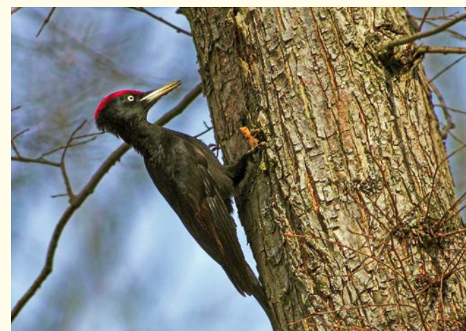
Schwarzspecht / Pic noir (Kai)

En parallèle du vieux Rhin s'écoulent une multitude d'anciens bras du fleuve, caractéristiques de ce secteur, où vivent coquillages, poissons, écrevisses, grenouilles, tritons et larves de libellules prédatrices. Les visiteurs les plus chanceux parviendront à apercevoir une couleuvre à collier ou un martin-pêcheur d'Europe. Dans la roselière qui longe la rive couverte de végétation, couve le râle d'eau, un oiseau farouche. On trouve