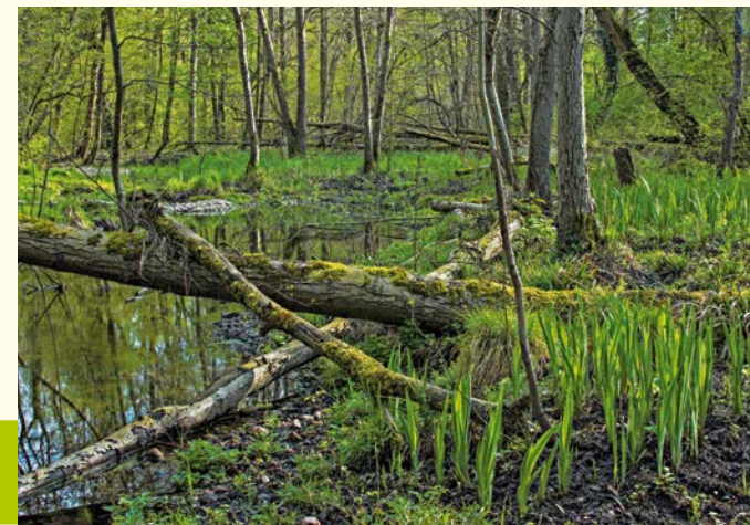
Auwald / Forêt alluviale (Kai)

La réserve naturelle du Taubergiessen offre un habitat à un très grand nombre d'espèces animales et végétales rares, vulnérables et parfois menacés d'extinction.