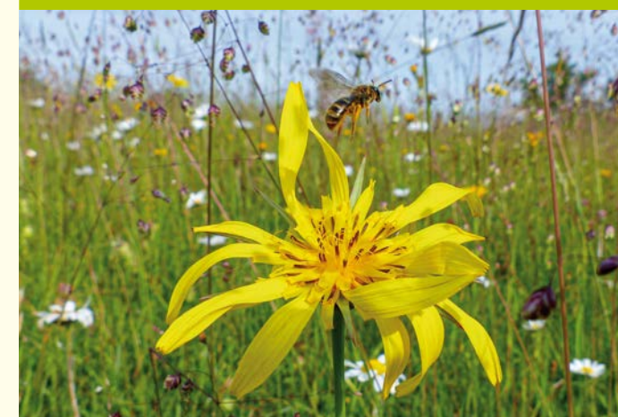
Wiesenbocksbart / Salsifis des prés (Gor)

Tausende von Wasservögeln finden sich jährlich als Durchzügler und Wintergäste auf den offenen Wasserflächen ein. Vom Beobachtungsturm aus kann man mehr als ein Dutzend Entenarten, Gänse und im Sommer auch Flusseechwalben erspähen. Die gewässerreichen Waldgebiete bieten einen