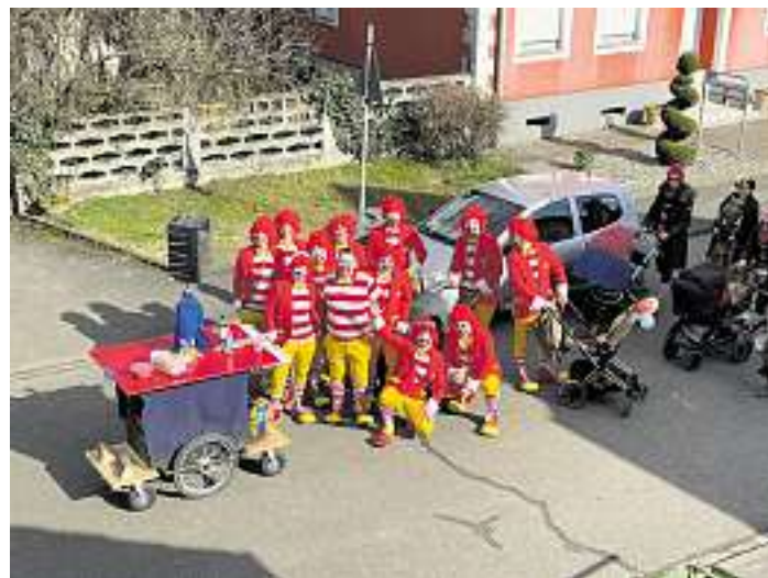
Einige Narren beim Narrentreiben in Grafenhausen.