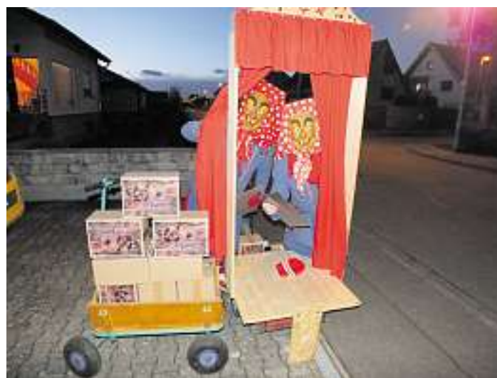
Aktive Mitglieder der Hexenzunft Grafenhausen beim Verteilen der Zunftobendkistli.