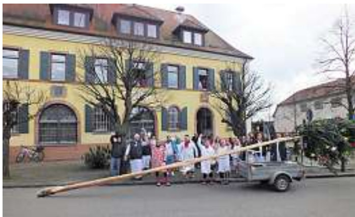
Das Stellen des Narrenbaumes durch den Narrenverein Rhinschnooge Kappel vor dem Rathaus in Kappel.

In kleinen Gruppen zogen am Samstagnachmittag in Grafenhausen einige Narren durch das Dorf. Mit schräger Fasendmusik wollte man trotz der angespannten Situation in Europa für einen kurzen Moment an die närrische Zeit erinnern. Auch Queen Elizabeth von England machte einen Besuch, um in der Corona-Zeit Mut und Hoffnung zu machen. Mit Applaus und Zuwinken wurden die Narren von vielen Beobachtern, sei es am Straßenrand, von ihren Häusern oder vom Auto aus, belohnt und man konnte auch viele fröhliche Gesichter erkennen.